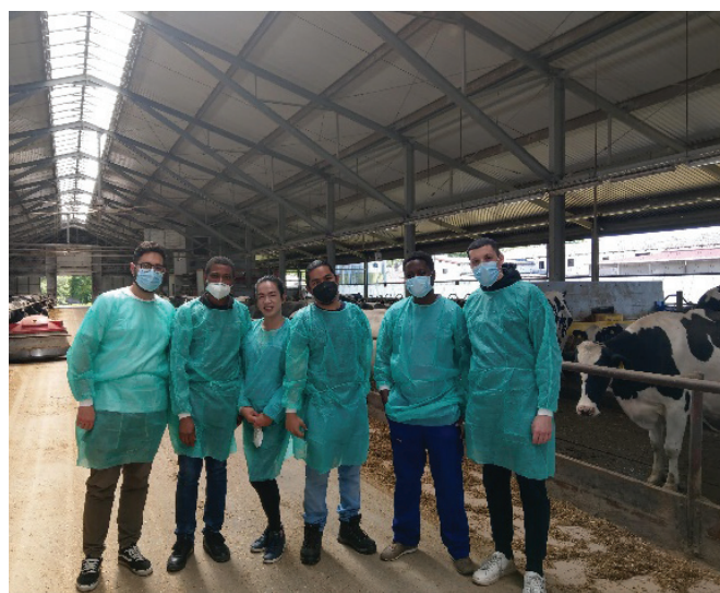
Fot. 2. Studenci kierunku Animal Production Management w trakcie ćwiczeń terenowych

Namacalnym dowodem wysokiego poziomu nauczania jest fakt, iż w rankingu Perspektyw już po raz czwarty z rzędu Zootechnika – „flagowy” kierunek studiów prowadzonych na Wydziale, uzyskał najwyższą notę w kraju. Potwierdza to również wzorowa ocena wystawiona temu kierunkowi przez Polską Komisję Akredytacyjną (PKA). Pozostałe prowadzone na Wydziale kierunki studiów mają pozytywną ocenę PKA. Warto podkreślić, iż na ogólną, bardzo dobrą ocenę działalności dydaktycznej Wydziału składają się również indywidualne osiągnięcia najlepszych studentów. Wielu z nich jest współautorami publikacji naukowych oraz laureatami licznych nagród i stypendiów (m.in. prestiżowego „Diamentowego Grantu”). Szczególnie cieszy nas fakt, iż po uzyskaniu dyplomu wielu studentów wybiera ścieżkę kariery naukowej, rozwijając swoje pasje badawcze w ramach kształce-