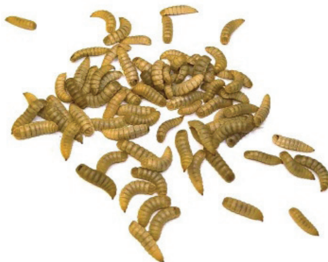
Fot. 1. Larwy muchówki Hermetia illucens – źródło białka i tłuszczu w żywieniu m.in. drobiu i ryb

pochodzące ze źródeł zewnętrznych, w tym z projektów europejskich. Również w tym zakresie WMWZ może poszczycić się znacznymi sukcesami. Szczególnym przykładem innowacyjnych badań, które mają ogromną szansę na wdrożenie do praktyki, są prace nad wykorzystaniem owadów jako źródła białka i tłuszczu w żywieniu zwierząt gospodarskich i towarzyszących (fot. 1), prowadzone pod kierunkiem prof. Damiana Józefiaka. Innym nurtem badawczym, doskonale wpisującym się w ogólnoświatowe trendy mówiące o konieczności globalnego ograniczenia emisji gazów cieplarnianych, są badania nad wpływem genetyki na zmienność poziomu metanu produkowanego przez krowy mleczne oraz nad wpływem żywienia na rozmiar emisji metanu.